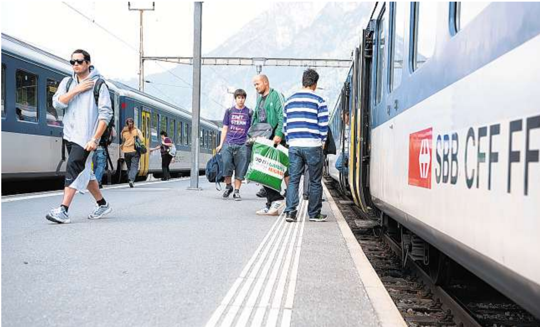
Umstrittene Parolenfassung: Der Gemeinderat Glarus Süd gerät mit der Zustimmung zum ÖV-Memorialsantrag in die Bredouille.